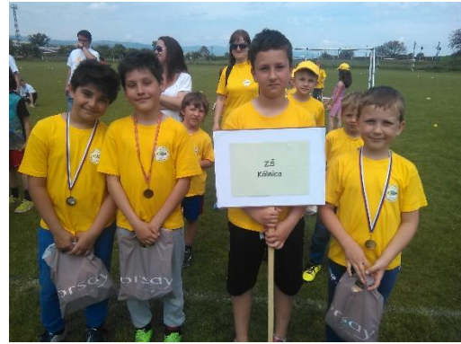
Olympiáda – Opatová