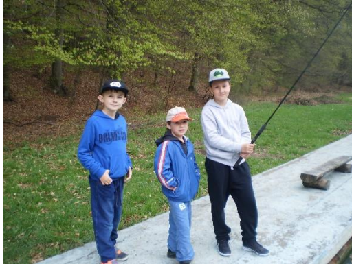
Škola v prírode -Fantázia