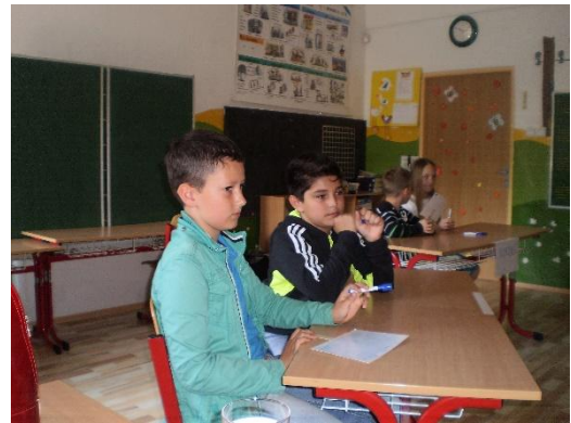
Prírodovedná olympiáda Selec