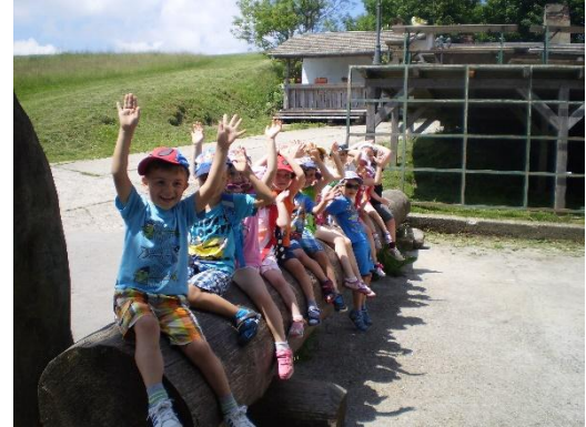
Holubyho chata Javorina